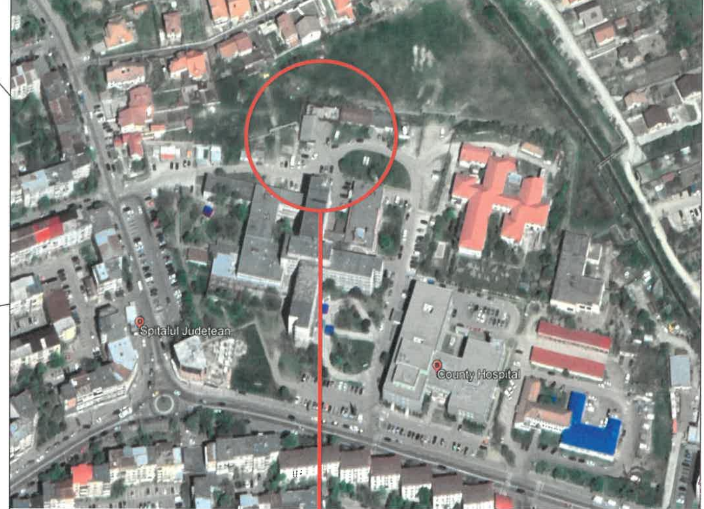
ÎNCADRAREA ÎN ZONĂ