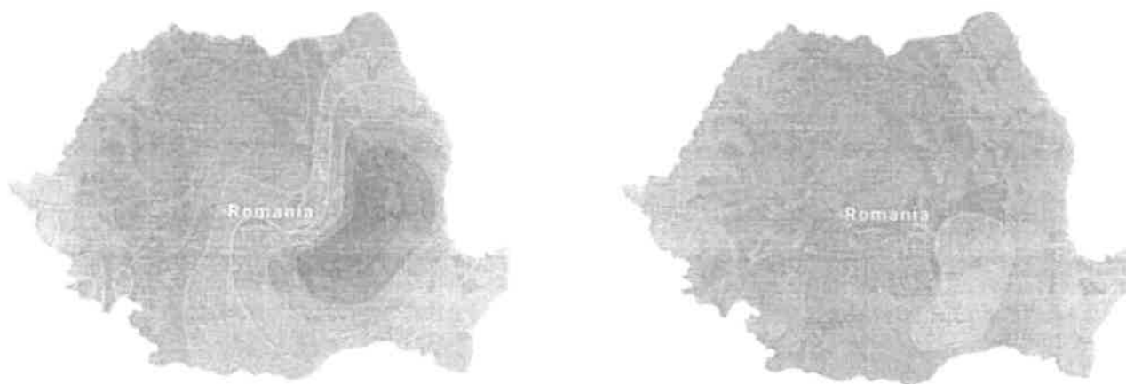
Figura 1 – Hartă de zonare seismică (PGA) în termeni de valori de vârf ale accelerației terenului (stânga) și Hartă de zonare seismică (TC) în termeni de perioada de control (colț) a spectrului de răspuns (dreapta)

Construcția este amplasată în loc. Drobeta Turnu Severin, jud. Mehedinți. Conform hărților de zonare seismică, construcția este situată într-o zonă ce corespunde unei accelerații la nivelul terenului a_g = 0.15g ( g = 9.81 \text{ m/s}^2 – accelerația gravitațională), cu o perioadă de colț a spectrului seismic T_c = 0.7 \text{ sec} , pentru un seism cu intervalul mediu de recurență de 225 ani (cutremurul ce este luat în considerare la starea limită ultimă – SLU). Coeficientul de amplificare dinamică este, conform cu reglementarea tehnică P100/1-2013 (completată și modificată de Ordinul nr. 2956/2019), \beta_0 = 2.50 , pentru intervalul TB-TC.